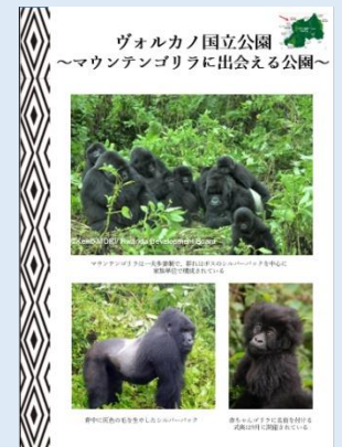
展示より一部を抜粋しました。